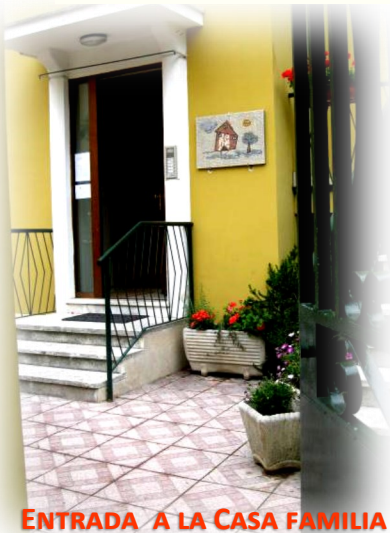
ENTRADA A LA CASA FAMILIA

Por cierto, no te has olvidado de hacer funcionar entre las paredes de la casa lo que se llama "el espíritu de familia", con una brisa, un espíritu de cotidia-