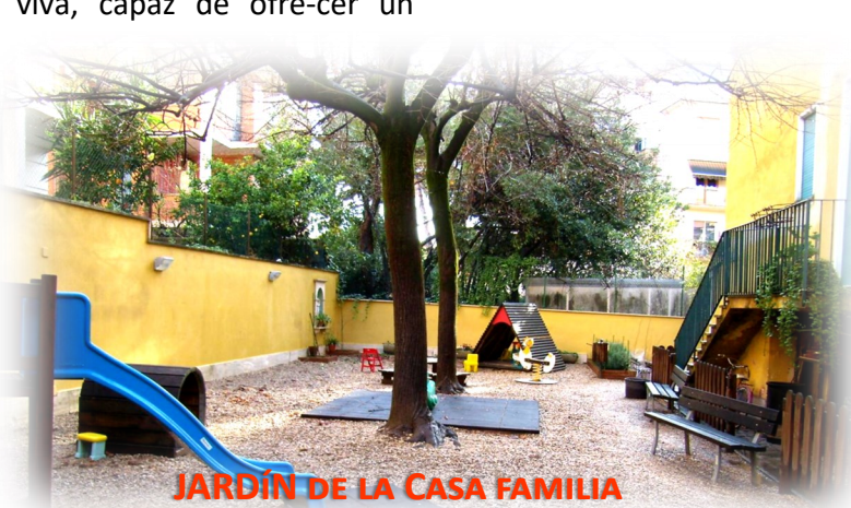
JARDÍN DE LA CASA FAMILIA