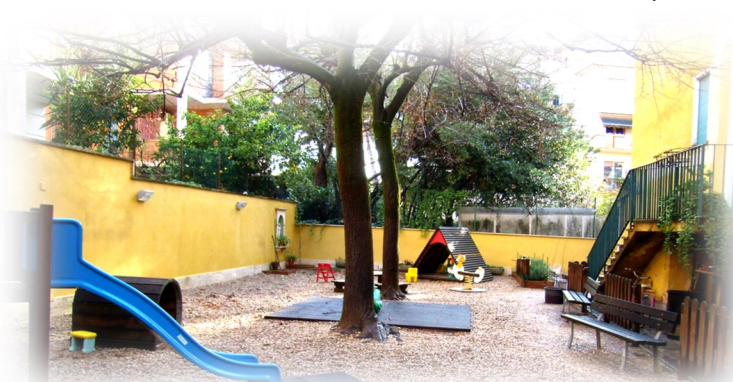
JARDIM DA CASA FAMILIA

Entre outras coisas, não Te esqueciste de fazer funcionar dentro das paredes da casa, na brisa serena, o que se chama "o espírito de família",