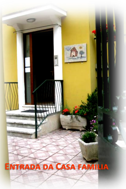
ENTRADA DA CASA FAMILIA