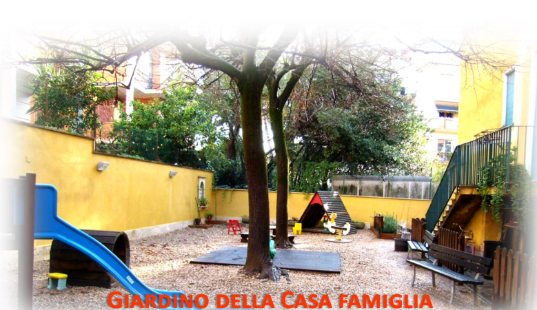
GIARDINO DELLA CASA FAMIGLIA

Tra l'altro, Tu non hai dimenticato di far funzionare fra le mura della casa, a