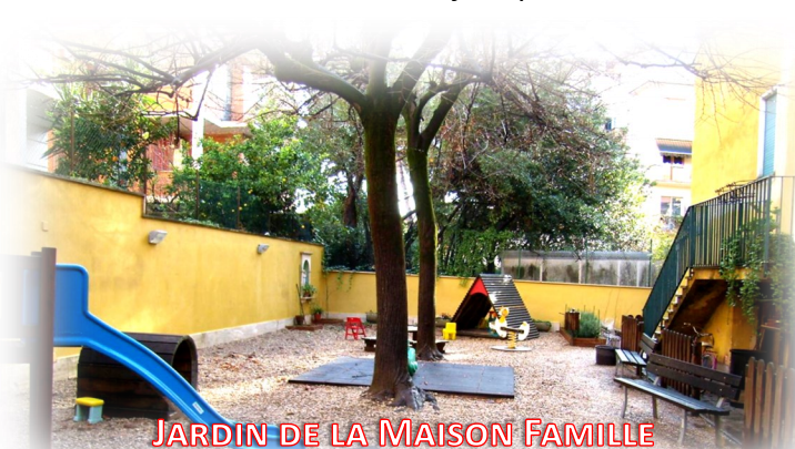
JARDIN DE LA MAISON FAMILLE