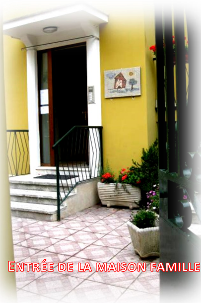
ENTRÉE DE LA MAISON FAMILLE

Par ailleurs, Tu n'as pas oublié de faire fonctionner entre les murs de la maison, en régime de souffle, ce