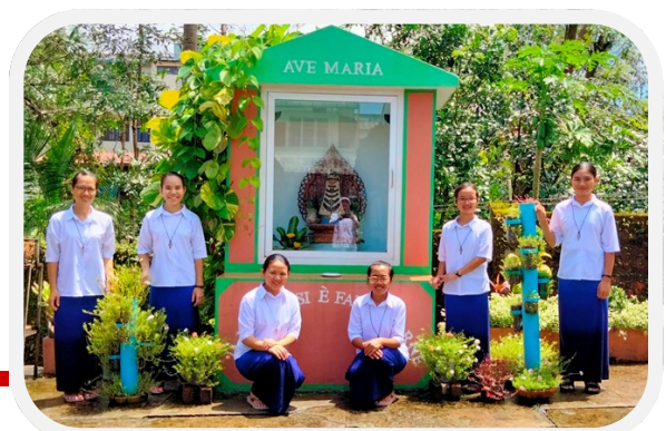
De Yangon, les novices de la délégation

Humblement, nous demandons également à vous toutes de continuer à prier avec ferveur pour notre cher Myanmar. Merci.